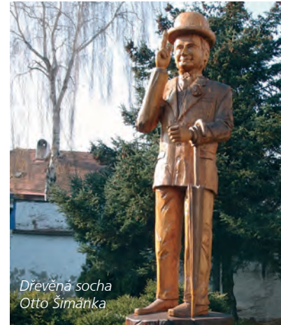
Dřevěná socha Otto Šimánka

Snad každý zná pána s buřinkou. Věděli jste, že právě OTTO ŠIMÁNEK , který ztvárnil tuto roli, pocházel z Třeště? Město se rozhodlo uctít památku tohoto excelentního českého mima a herce, a tak nechalo vyrobit dřevěnou sochu, kterou můžete vidět u autobusového nádraží v Třešti.